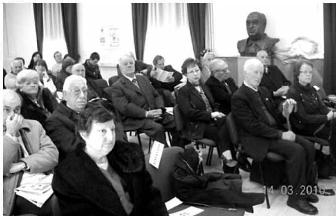
Il pubblico in sala.